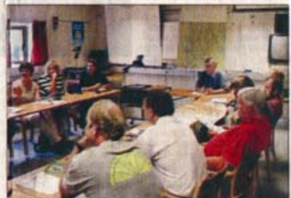
Samlade krafter. En rad olika instanser samlades i går i Munkfors för att gemensamt planera räddnings- och uppbyggnadsarbetet.